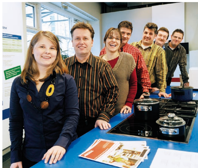
Ihr Kundenberater-Team der Stadtwerke

Weitere Informationen über Energiedienstleister, Anbieter von Energieeffizienzmaßnahmen und zu Energieaudits finden Sie auf der Webseite der Bundesstelle für Energieeffizienz (BfEE) unter www.bfee-online.de . Infos zu Verbraucher-Organisationen und Energieagenturen gibt es unter www.energieeffizienz-online.info .